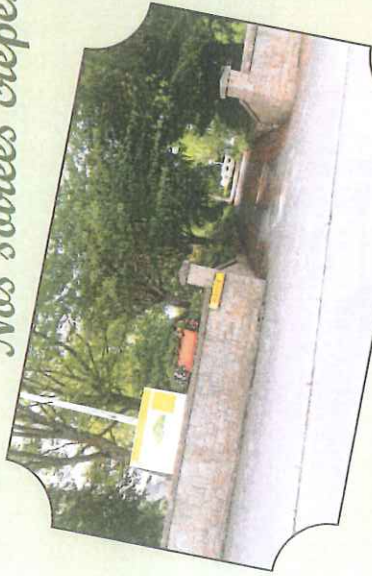
Entrée du camping