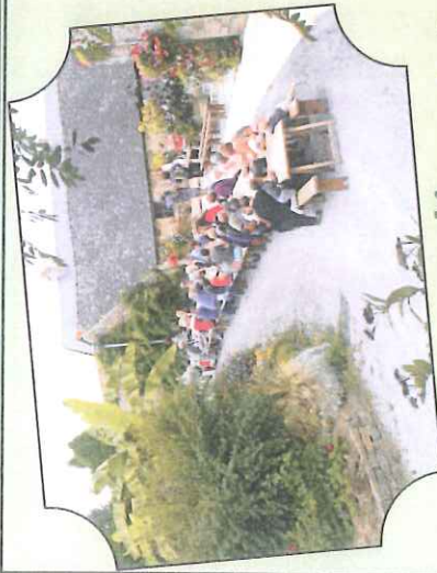
Nos soirées crêpes