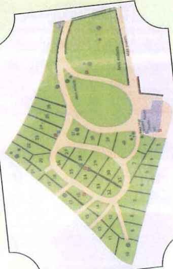
Plan du camping