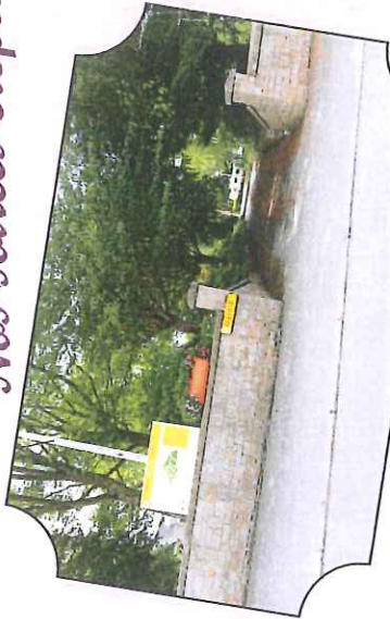
Entrée du camping