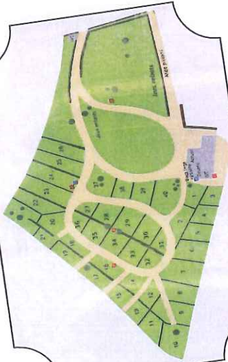
Plan du camping