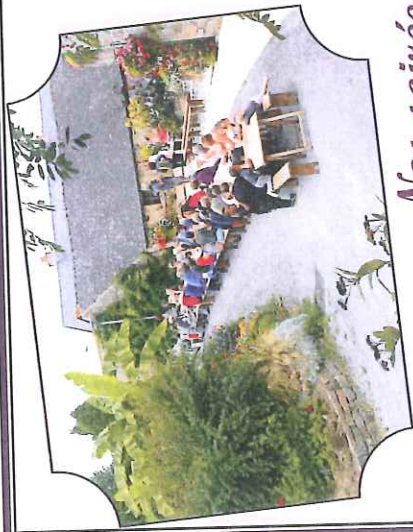
Nos soirées crêpes